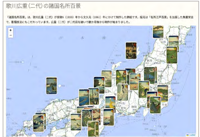
錦絵等を地図上に並べて見られるページ