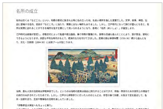
名所にまつわるコラムのページ