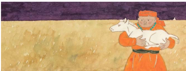
『スーホの白い馬』より 赤羽末吉 1967 ちひろ美術館蔵