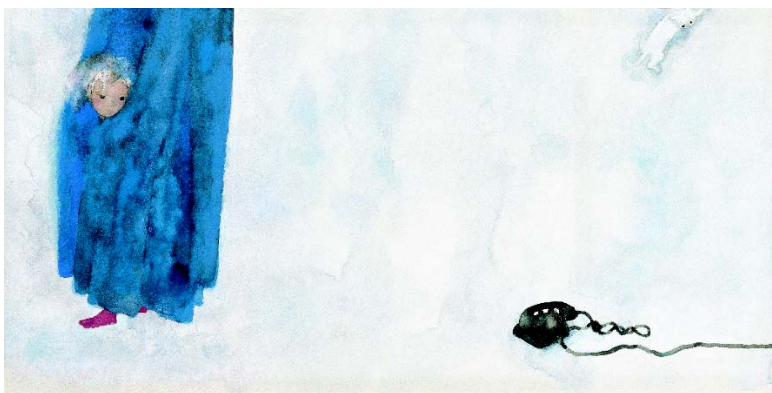
『あめのひのおるすばん』より いわさきちひろ 1968 ちひろ美術館蔵