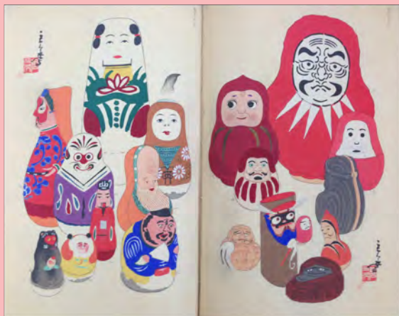
「人形」関連資料 『起上小法師画集』 (川崎巨泉画、大正13-14年)