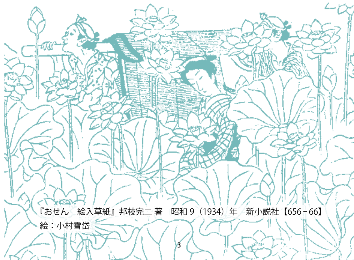
『おせん 絵入草紙』邦枝完二 著 昭和9（1934）年 新小説社【656-66】 絵：小村雪岱

印刷・表現技法の発達を受け、大衆文化の移り変わりともあいまって多様化してきた挿絵の世界を、明治の新聞、大正・昭和の少年・少女雑誌、SF小説や時代小説、平成のライトノベルなど所蔵資料約90点でご紹介します。