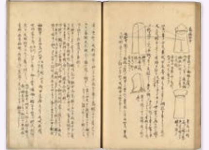
飯島光峨「旅日記」(前期展示箇所)