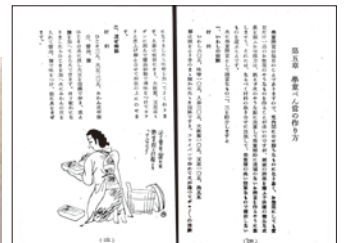
神奈川県食糧営団 編「決戦食生活工夫集」産業経済新聞社、昭和19(請求記号 596-Ka43ウ) ※戦時中の弁当のレシピ。