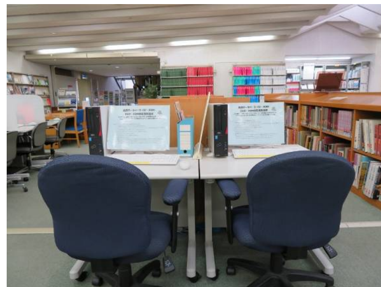
利用者用 (データベース用端末)