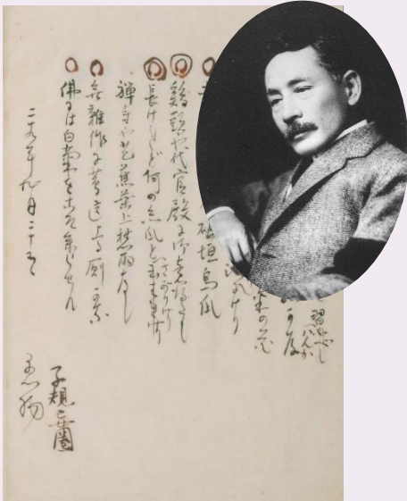
夏目漱石真蹟併稿【本別 3-61】