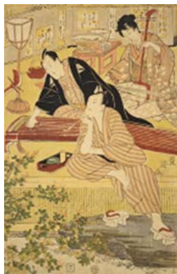
歌川豊国「三十六ばんつゞき役者十二つき」より、三代目坂東三津五郎が箏を弾いている錦絵（出典：豊国画『初代豊国錦絵帖』文化頃 <請求記号 寄別 2-6-2-6>）

■ 取り上げた資料の一部（下の URL から詳細な画像、資料の中身をご覧ください。）