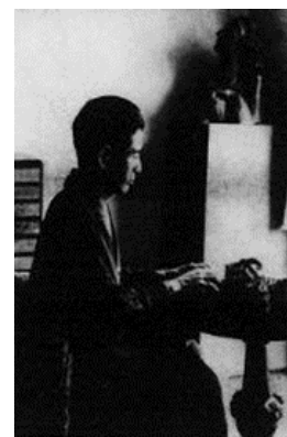
「春の海」等、数々の名曲を作った宮城道雄（出典：宮城道雄『夢乃姿』那珂書店，昭和 16 <請求記号 914.6-Mi734 ウ>）