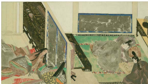
『源氏物語』から、帝と中納言源薫の対局の場面 (出典：世尊寺伊房 詞書；藤原隆能 画『源氏物語絵巻』)

(URL : http://www.ndl.go.jp/kaleido/entry/22/ から詳細な画像、資料の中身をご覧ください)