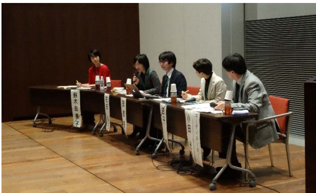
昨年度のフォーラムの様子

時事問題、歴史、統計、法律、人物調査など、図書館には専門的なことから生活に役立つ情報まで日々様々な質問が寄せられます。レファレンス協同データベースではそうした「〇〇を調べるには？」に答えたデータを全国の図書館から集め、蓄積しています。今回のフォーラムでは図書館に関わる様々な立場の方をお招きし、各図書館におけるデータ登録・公開の推進と市民が利用しやすいデータベースづくりについて議論します。