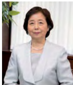
国立国会図書館長

国立国会図書館で働くことは、このように日本で唯一の特別な図書館を支えるという極めて重要な役割を担うことを意味します。国の知的基盤と文化創造の礎となり、ひいては日本の未来を築くために、気概のある優れた皆様と共に働くことを楽しみにしています。